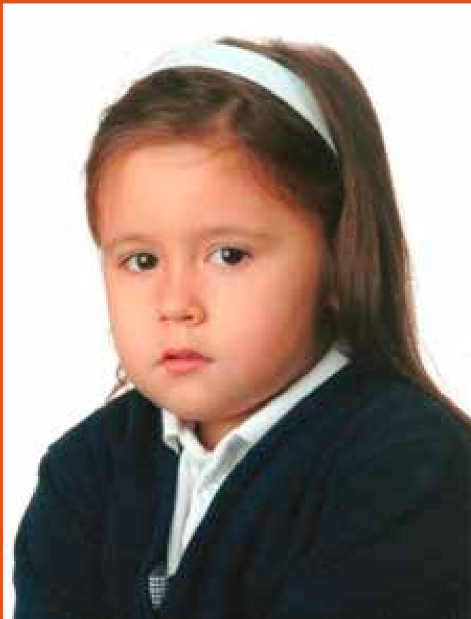
Recuerdo de mi etapa escolar a los 4 años (2008)