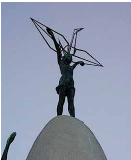
Monumento a la paz de los niños de Hiroshima

D esde el colegio Irlandesas de Loreto se ha organizado el Proyecto Mil Grullas por la paz. Este Proyecto parte de nuestra implicación en el fomento de la paz y la buena convivencia en nuestros colegios y en toda la sociedad.