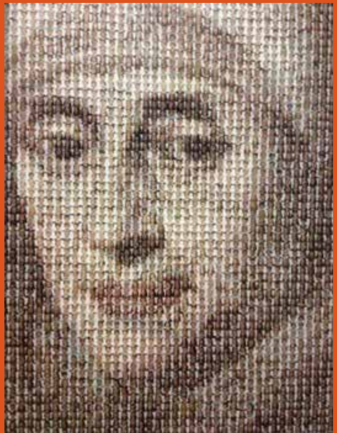
Cuadro Mary Ward hecho con imágenes de los alumnos del colegio

como el retiro de Effetá , esa fe se hizo luz, y entendí que la oración es el oxígeno que me permite mantener la paz en medio del ruido.