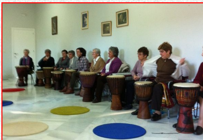
Latidos del Corazón. Oración y experiencia

Al día siguiente, rezamos bailando, bendiciendo la tierra que pisamos y nos sostiene, bendiciéndonos, bendiciendo a las personas que nos han precedido y nos bendecimos a nosotras mismas