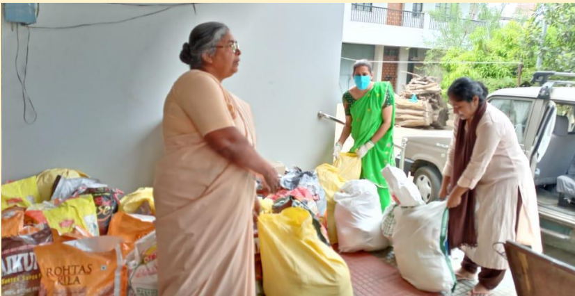
La Provincia Patna CJ Patna (arriba) y Kolkota Mary Ward Social Service Center (derecho) en India distribuyendo comida a los trabajadores emigrantes y a gente que han perdido su modo de vida.