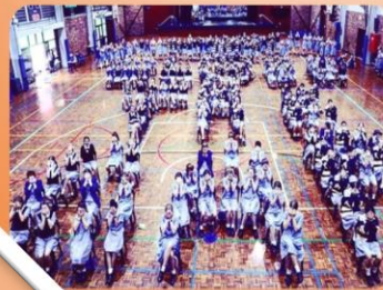
Close the Gap (Australia)

The Blanket Exercise, Canadá. En su informe final el Comité de la Verdad y la Reconciliación (TRC) atribuyó el actual estado de relaciones problemáticas ente la gente indígena y no en Canadá a “las instituciones escolares y a lo que éstas habían enseñado o dejado de enseñar a lo largo de muchas generaciones”. En respuesta a la Llamada a la Acción, el Centro Mary Ward en Toronto, ofrece “The Blanket Exercise” para el alumnado y los adultos, una iniciativa de educación no formal llevada a cabo por la Provincia IBVM de Canadá. Lee más información acerca de ello en http://www.marywardcentre.ca/centre-news.html