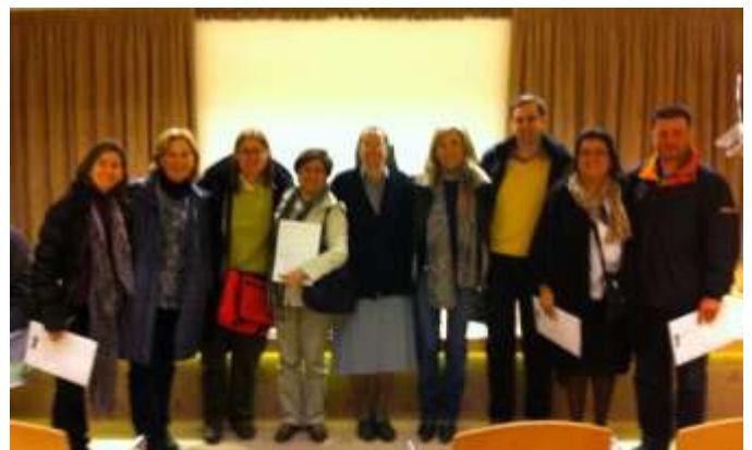
Responsables de Pastoral en los colegios B. V. María, junto a las religiosas que impartieron el curso.