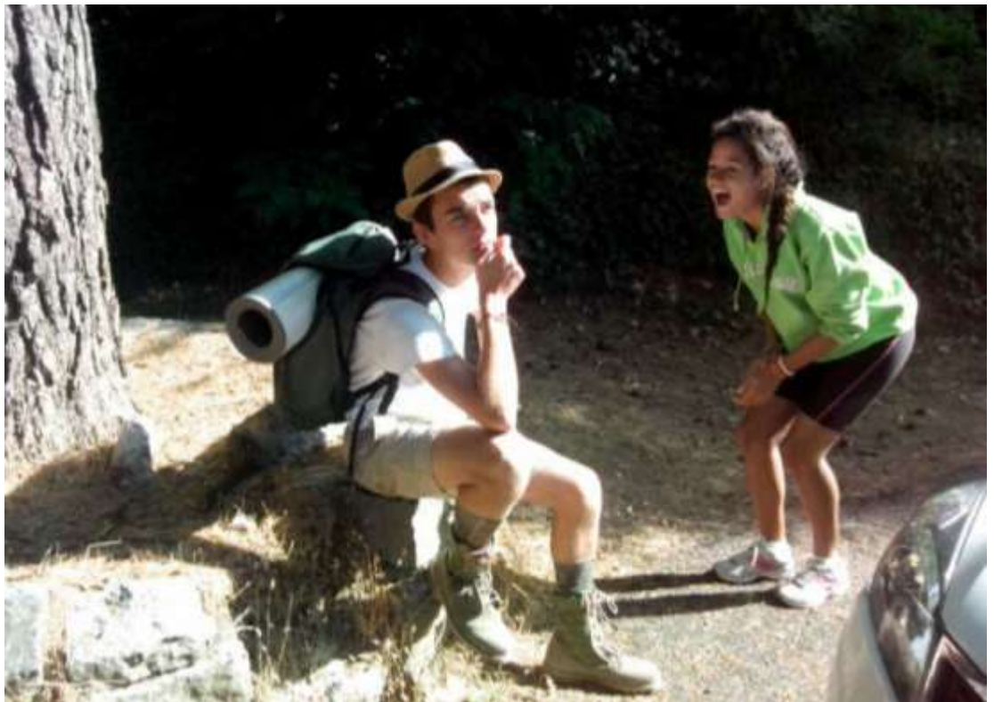
Una propuesta atrevida y nueva organizada por la Pastoral Provincial. Un curso de monitores cristianos de ocio y tiempo libre en el que formarse académica y humanamente.

El que nuestros chicos y chicas descubran una vocación de servicio hacia los más pequeños en los grupos de Fuego Nuevo es un auténtico reto que nos impulsa a seguir formando a nuestros alumnos/as, a apostar por una