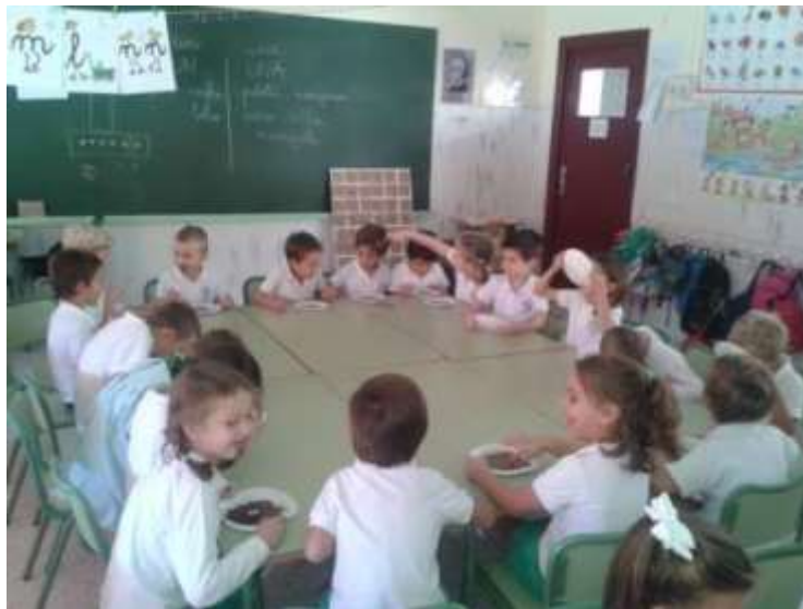
Matemáticas divertidas (izquierda) y taller sensorial del chocolate. Formas diferentes de aprender que ya se están poniendo en marcha en el colegio B.V.M. de Bami (Sevilla)