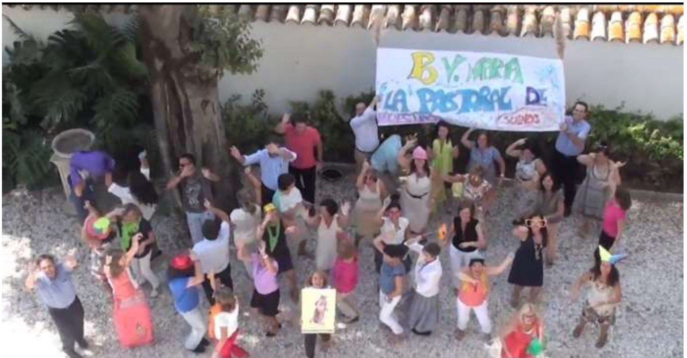
Un momento del Lipdub realizado en Castilleja de la Cuesta por los equipos directivos de los seis colegios del IBVM.

Una de las patas de este curso es la teoría del psicólogo americano Howard Gardner y las Inteligencias Múltiples. Durante muchos años la enseñanza ha girado en torno al hemisferio izquierdo del cerebro y las inteligencias lógico-matemática y lingüístico-verbal, pero ¿qué pasaba con el alumnado con más inteligencia musical, kinestésico-corporal, visual-espacial, naturalista, etc? Un aprendizaje para cada alumno es lo que perseguimos al trabajar por