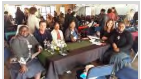
Tras las conferencias se trabajó en un documento final partiendo de los Principios Educativos. La "brújula" de los colegios de Mary Ward para el siglo XXI

Que desarrolla formas eficaces que permita a la juventud participar con seguridad y ética en los medios sociales y en la tecnología emergente, favoreciendo así las oportunidades para el aprendizaje y la creación de una ciudadanía global y digital. Conocedores de los valores que el mundo de hoy necesita para que nuestra educación sea relevante y responda a la realidad presente.