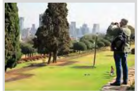
También tuvimos tiempo para conocer algo del país que nos acogía. Al fondo la ciudad de Pretoria

otras organizaciones, sobre la Agenda 2030 para los Objetivos de