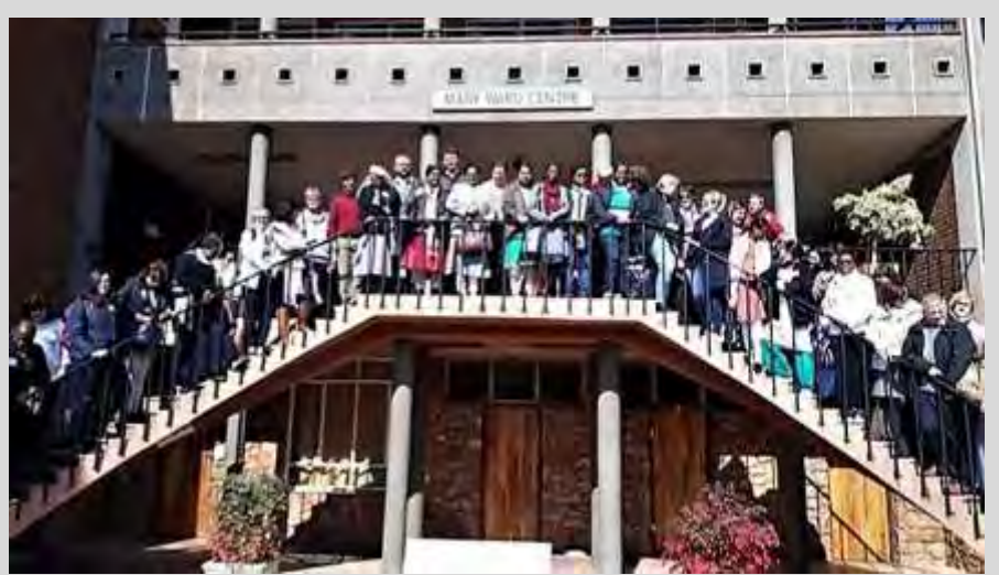
Foto de grupo de todos los participantes, en la entrada del Loreto Queenswood

Rooted, Responsive, Relevant. Enraizado, Sensible, Relevante. Este fue el lema de la Loreto Schools International Conference, que se celebró en Pretoria entre los días 25 de junio y 2 de Julio. El primer contacto de la delegación española fue el aeropuerto de Madrid. Momento de encuentro... y de presentaciones, ya que algunos de los miembros de la delegación no se conocían personalmente, aunque llevábamos un tiempo preparando conjuntamente el encuentro. Daba comienzo una experiencia que es imposible de relatar en toda su profundidad y riqueza en estas pocas líneas. ¡Pero vamos a intentarlo! Tras un largo viaje, que atravesó el continente africano de norte a