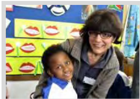
Con el alumnado de infantil en el Loreto Convent

El miércoles 26 de junio comenzaron las sesiones de trabajo propiamente dichas. Y la delegación española fue la