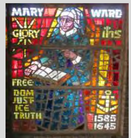
Vidriera en el Loreto Queenswood