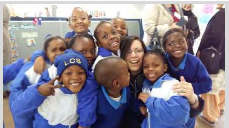
Visita al Loreto Convent School, el colegio Loreto más antiguo de Sudáfrica

El miércoles 28 fue un día muy especial. Volvimos al Loreto Convent School, para conocerlo más detenidamente. Tras una oración y exposición interesantísima de la historia del Instituto en Sudáfrica, recorrimos instalaciones del colegio Loreto más antiguo en África sin perder