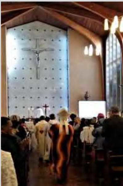
Eucaristía de apertura en Loreto Convent

de la reunión. Nuevo punto de encuentro en el aeropuerto con un gran cartel anunciador de la Conferencia y traslado a Pretoria, donde tendría lugar la “Loreto Schools’ International Conference”. Allí fueron llegando las distintas delegaciones con las que fuimos tomando contacto