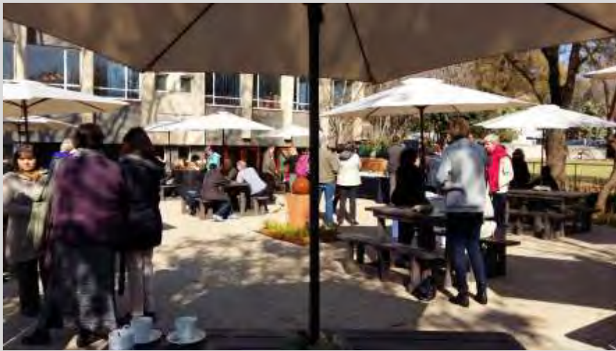
Junto al Theresa Ball Recreation Room tuvimos nuestros momentos de descanso entre sesiones, que aprovechamos para intercambiar experiencias y conocer de primera mano las distintas realidades de los colegios de Mary Ward

Abrazando y afirmando la diversidad humana como reflejo de la maravilla de la Creación y animando a los jóvenes a descubrir su interdependencia para que cada persona encuentre su dignidad.