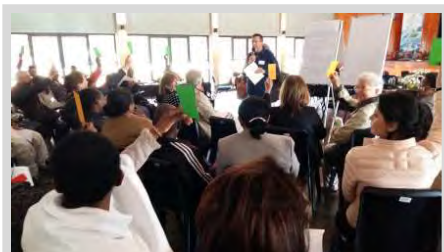
Última sesión de trabajo

Tras el final de las distintas conferencias, desde la tarde del viernes comenzamos las sesiones de trabajo por grupos enfocadas a concluir el Encuentro con unas orientaciones que, partiendo de los