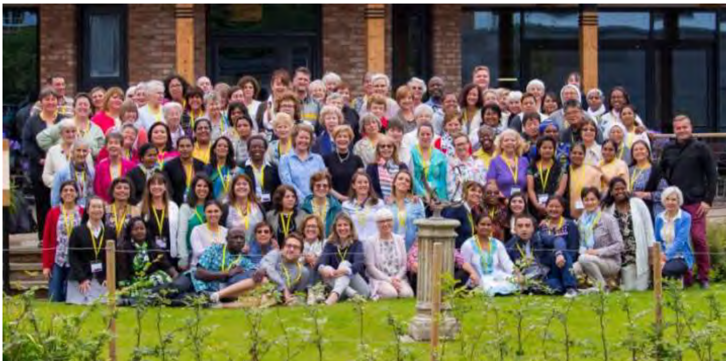
Foto de grupo de las personas asistentes

Entre el 7 y el 14 de agosto de 2017, 120 amigas y amigos de Mary Ward se dieron cita en York, Reino Unido, para celebrar su Segundo Encuentro Internacional. El primero tuvo lugar en 2014, en Loyola, España.