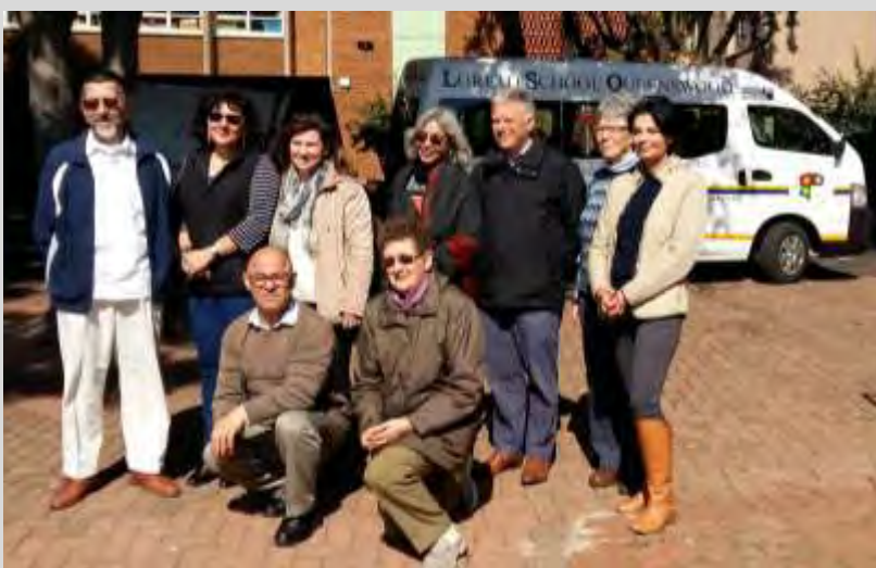
El equipo organizador de la Conferencia de Colegios de Mary Ward de Sudáfrica.

Y así fuimos llegando al final de esta experiencia. Una Conferencia intensa, con mucho tiempo de trabajo, pero también con la oportunidad de relacionarnos, de