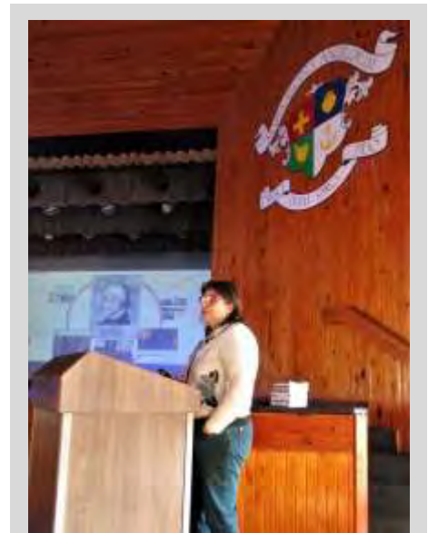
La primera reflexión de la mañana en la Conferencia correspondió a la Provincia de España

de Pretoria, Loreto Schools Queenswood. Las sesiones se iniciaban con una reflexión u oración inicial. Constaban de dos temas al día, uno por la mañana y otro tras el almuerzo: cada tema se estructuraba con una exposición por un ponente y tras un tiempo de descanso un trabajo en grupos –siempre distintos– enriquecido por las aportaciones de cada participante, finalizando con una puesta en común y unas