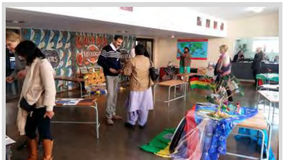
Hall de entrada a la sala de conferencias donde quedaron expuestos distintos materiales traídos de los países participantes