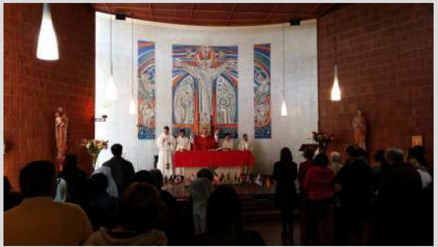
Eucaristía de clausura en la capilla de Loreto Queenswood

comprender con nuestra propia vivencia el sentido profundo de lo que habíamos trabajado: desde nuestra diversidad, propia de un Instituto repartido por todo el mundo, cómo puede seguir aportando el carisma de Mary Ward a las generaciones del siglo XXI; relacionarnos tanto por la dinámica de las propias sesiones, como en los momentos de descanso, de café en La “Theresa Ball recreation room”; las conversaciones durante los traslados al colegio; en los desayunos o en las largas sobremesas tras la cena; en las vistas a los colegios; en los en la participación en las eucaristías.