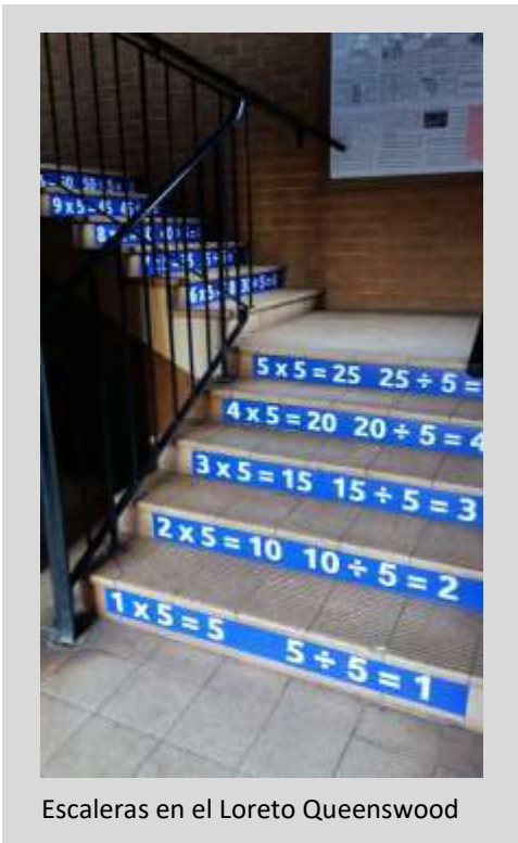
Escaleras en el Loreto Queenswood

desde el primer momento de manera informal.